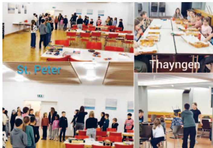
Kinderabend in Thayngen

Kinder- und Jugendkleider über Schuhe, Spielzeug, Bücher und Spielsachen bis zu Badesachen, Schwangerschaftsmode und Autositzen. Somit wurden über diesen Samstagmorgen fast 1000 Artikel verkauft. Eine besondere Freude war die rege Teilnahme sowohl von langjährigen Unterstützenden als auch von NeukundInnen, die zum ersten Mal unsere Börse besuchten. Die entspannte und freundliche Atmosphäre trug massgeblich zum gelungenen Miteinander bei. Die ehrenamtlichen Helferinnen sorgten mit ihrem Engagement für einen reibungslosen Ablauf und standen den Besuchern mit Rat und Tat zur Seite. Mit dem Erlös der Börse unterstützen wir in diesem Jahr das ruandische Hilfsprojekt Coereso. Die Spendensumme von ca. Fr. 700 wird einen wertvollen Beitrag zur Verbesserung der Lebenssituation vor Ort leisten. Zusätzlich konnten wir 500 gespendeter Kleider und 40 Paar Schuhe dem Projekt Licht im Osten übergeben. Unser Dank gilt allen VerkäuferInnen und KäuferInnen, die durch die Teilnahme dieses wichtige soziale Engagement ermöglicht haben. Nach dem erfolgreichen Verlauf dieses Jahr freuen wir uns bereits auf die nächste Kinderartikelbörse im Jahr 2026. Wir hoffen, dann wieder viele bekannte und neue Gesichter begrüssen zu dürfen. Ein herzliches Dankeschön an alle Beteiligten – von den