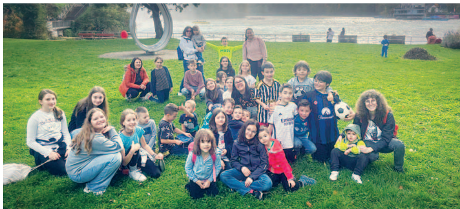
Settimana Oratorio Ottobre 2024