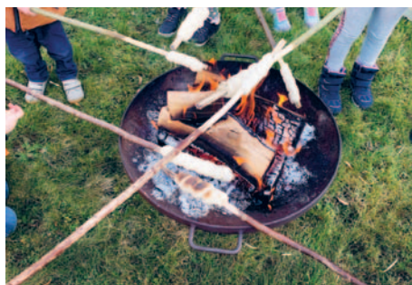
Schlangensbrot über dem Feuer – köstlich!