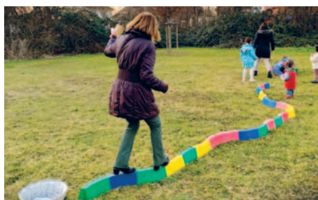
... auch die Erwachsenen hatten Spass beim Parcours