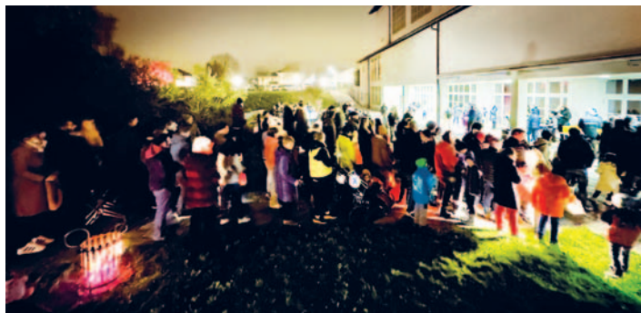
Auf dem Weg.

Am Samstag, 9. November, feierten wir in unserer Pfarrei das traditionelle St. Martinsfest. Der festliche Familiengottesdienst wurde von unserer Jubla kreativ mitgestaltet und durch ein beeindruckendes Martinsspiel bereichert. Im Zentrum des Spiels stand die Legende des Heiligen Martin, der für seine selbstlose Nächstenliebe und seinen Einsatz für Bedürftige bekannt ist. Die Jubla verband die alte Legende mit einem modernen Beispiel: In der Geschichte spielte Martina, ein Mädchen von heute, die Rolle einer alltäglichen «Martina», die durch kleine Taten im Alltag Nächstenliebe lebendig werden lässt. Nach dem Gottesdienst fand der traditionelle Laternenumzug