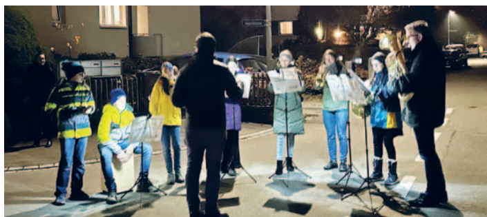
Harmonie Juniors Amriswil bei der Zugbegleitung.