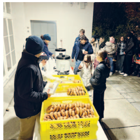
Bewirtung in der Arena – herzlichen Dank unserer Jubla!