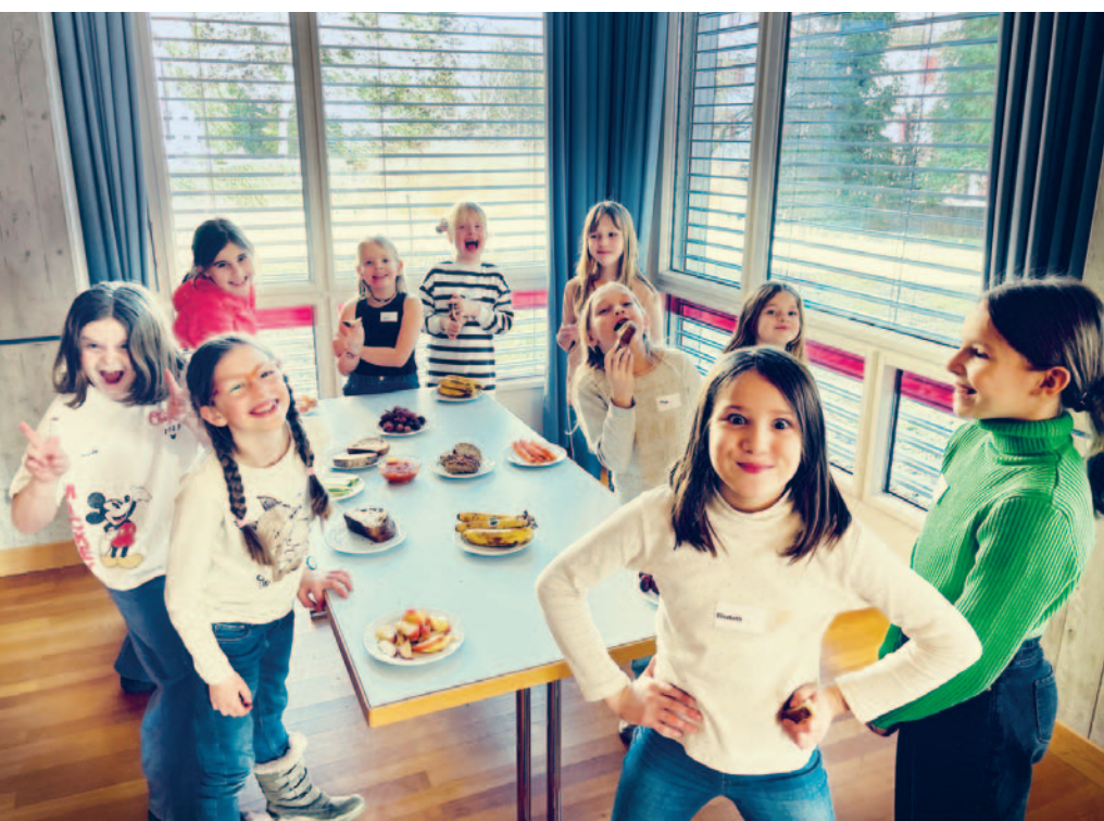
Fastenkonformer Zvieri im Katholischen Arboner Theater.