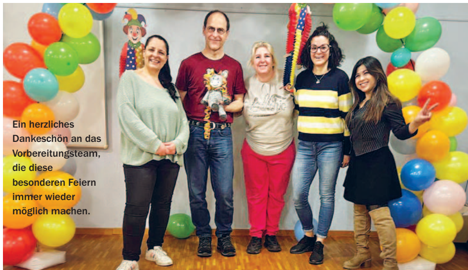
Ein herzliches Dankeschön an das Vorbereitungsteam, die diese besonderen Feiern immer wieder möglich machen.

Am Mittwoch, 2. April, von 15 bis 17 Uhr , sind alle Kinder bis zur ersten Klasse herzlich in die Oase eingeladen. Die Kleinen erwartet ein stimmungsvolles Erlebnis, mit einer Geschichte unseres Esels aus seinem Leben, ein Zvieri und Überraschungen rund um das