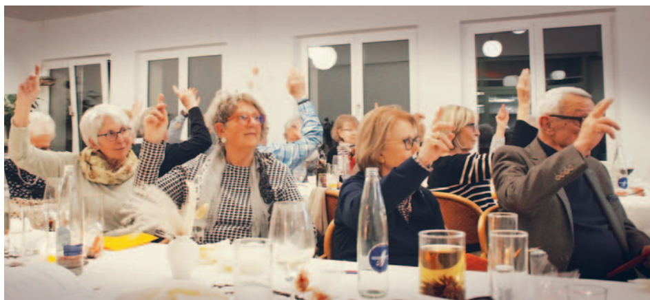
Abstimmung an der HV Kirchenchor