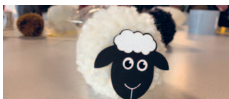
Eine der vielen schönen Bastelarbeiten...