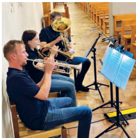
Eine Abordnung der Harmonie Juniors übernahm die musikalische Gestaltung des Familiengottesdienstes.