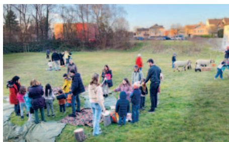
Gemeinschaft und Austausch bei den einzelnen Posten.