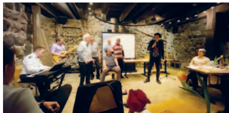
Das Highlight des Abends: Jailhouse-Rock im Schloss!

Mit dem traditionellen Kolpinglied endete die Versammlung und leitete über in ein geselliges Beisammensein, geprägt von Erinnerungen und Vorfreude auf die kommenden Anlässe. Bruno Lorandi