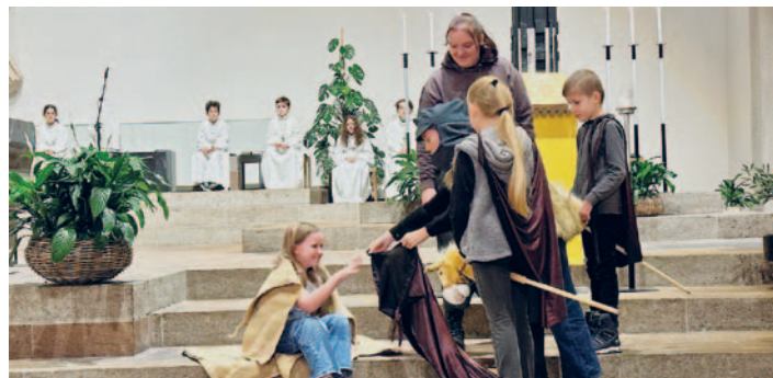
Unsere Jubla beim Martinsspiel.