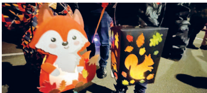
Viele schöne und bunte Laternen schmückten den Umzug.