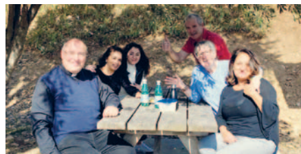
Viaggio a Lourdes