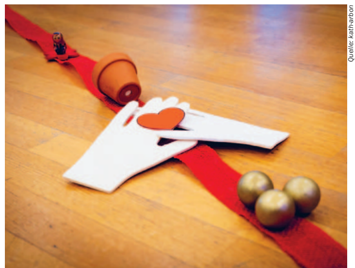
Die Firmanden beschäftigen sich mit Themen des Glaubens an den Firmtagen.